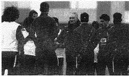
Tite fez mudanças na seleção canarinha que joga nesta sexta-feira na Rússia.

As principais seleções do futebol mundial voltam a campo nessa semana, em duelos que prometem muita emoção nos primeiros encontros entre as seleções antes do maior campeonato futebolístico do planeta: a Copa do Mundo 2018. Para começar, nesta terça-feira (20) haverá o confronto entre Iraque e Catar - próximo país a sediar o Mundial após os russos - às 21h, pelo horário de Brasília. Na quarta-feira (22), haverá o confronto entre Dinamarca e Panamá, às 16h. Nesta sexta-feira (23), a nossa Seleção Brasileira entra em campo para o amistoso contra a Rússia, no Estádio Luzhniki, a partir das 13h do horário de Brasília. O Brasil não irá contar com Neymar, que ainda se recupera da sua cirurgia no pé direito. Tite garantiu que Willian substituirá o atacante no time titular e Douglas Costa ganhará a vaga de Renato Augusto, deslocando Coutinho às pontas para o meio. Tite deve mandar a po no seguinte escalção: Alisson; Daniels Alves, Thiago Silva, Miranda e Marcelo; Casemiro, Paulinho, Willian e Philippe Coutinho; Douglas Costa e Gabriel Jesus. O Brasil ainda